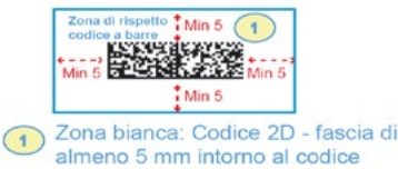
Figura 1 Codice Datamatrix

Al fine di garantire l'individuazione del codice 2D da parte dei sistemi di lettura automatica, è necessario riportare il codice al di sopra del blocco indirizzo (vedere layout di seguito riportati) e lasciare una zona di rispetto costituita da una fascia di colore bianco di almeno 5 mm di larghezza intorno al codice (vedi immagine di seguito riportata) attenendosi in ogni caso ai requisiti minimi riportati nell'apposita scheda tecnica sopra menzionata.